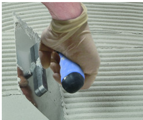
Keraflex Extra S1 felhordása fogazott simítóval

A falakon a hézagokat 4-8 óra eltelte után ki lehet fugázni, a padlón lévő hézagok 24 óra után fugázhatók. Használja a MAPEI széles színválasztékában elérhető cementkötésű vagy epoxi fugázóanyagait. A tágulási hézagokat a MAPEI speciális rugalmas hézagkitöltő anyagaival tömítse.