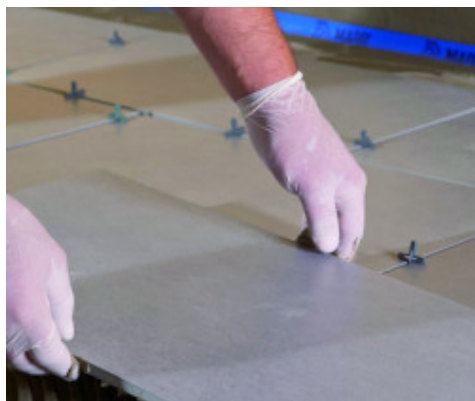
Porcelán lapok fektetése Keraflex Extra S1-gyel