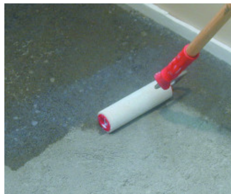
Primer G felhordása hengerrel