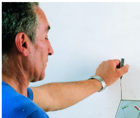
Vakolat nedvességtartalmának ellenőrzése