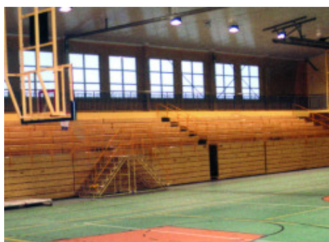
Tornateremben, PVC és linóleum burkolat előtt felhordott Primer G alapozóra példa – Gdansk Orunia Tornaterem – Lengyelország