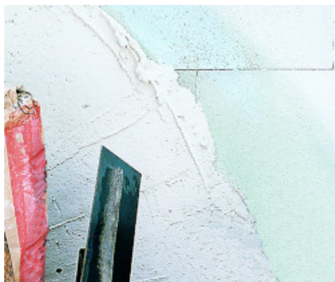
Használja alapozóként gipsz vakolatokra